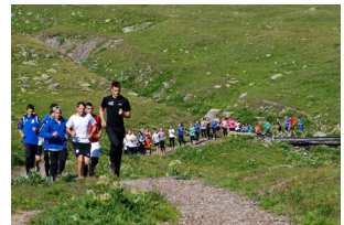
Trainingslager in St. Moritz