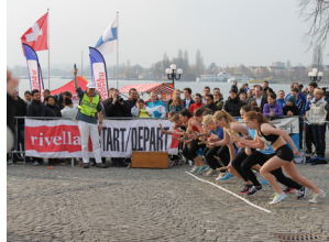
Quer durch Zug