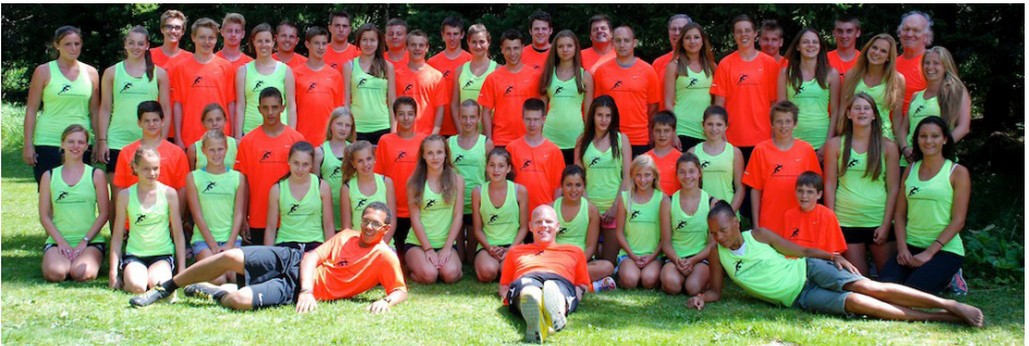
Trainingslager in St. Moritz